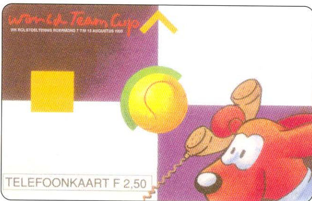
De voorzijde van de "Rollie" telefoonkaart. (Nog zonder sponsorlogo's).

Van 4 t/m 13 augustus 1995 zullen in het kasteelpark Hattem te Roermond de wereldkampioenschappen rolstoeltennis plaatsvinden. Een belangrijk gebeuren in de gehandicapten sportwereld waaraan zo'n dertig landen uit de gehele wereld gaan deelnemen. Deze wereldkampioen-